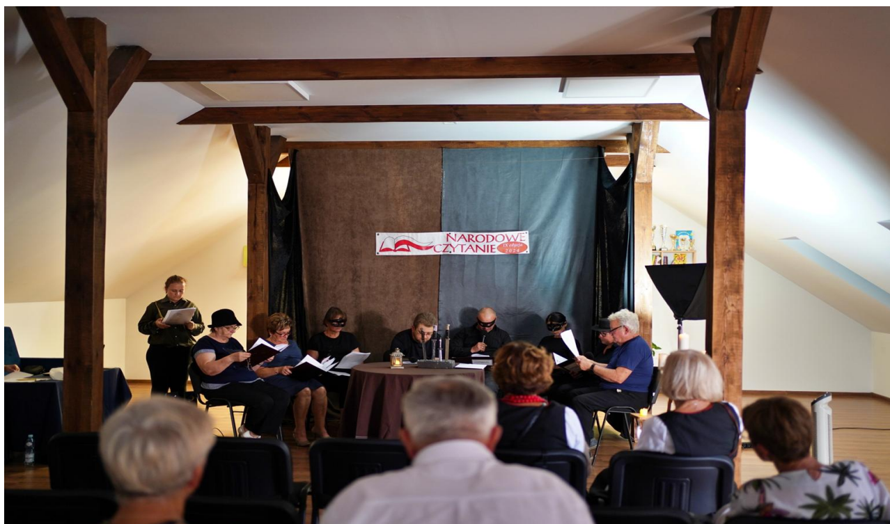
Narodowe Czytanie 2024.