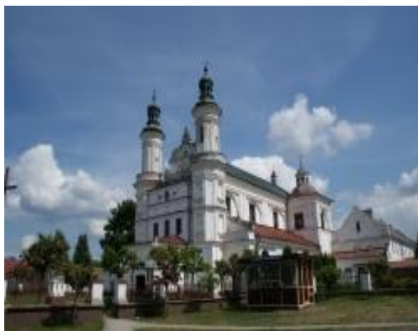
Kościół pw. Najświętszej Maryi Panny Królowej Różańca Świętego w Wysokim Kole

10) Uchwałą nr IV/27/24 Rady Gminy w Gniewoszowie z dnia 12 września 2024 r. przyznano dotację celową na prace konserwatorskie, restauratorskie lub roboty budowlane przy zabytkach wpisanych do rejestru zabytków położonych na terenie Gminy Gniewoszów na prace konserwatorskie, restauratorskie lub roboty budowlane przy zabytkach wpisanych do rejestru zabytków lub znajdujących się w Gminnej Ewidencji Zabytków na rzecz Parafii Rzymskokatolickiej pw. Świętego Stanisława Biskupa i Męczennika w Oleksowie, na zadanie pn. ” Remont konserwatorski zabytkowej dzwonnicy oraz ogrodzenia wokół Kościoła pw. Stanisława bp. i m.” w kwocie – 500.000,00 zł. Gmina Gniewoszów otrzymała wstępną promesę z Rządowego Programu Odbudowy Zabytków Polski Ład na zadanie w kwocie 490.000,00 zł. W tym gmina przekaże w formie wkładu własnego do inwestycji dotację w kwocie 10.000,00 zł. Prace dotyczą robót remontowo-konserwatorskich zabytkowej dzwonnicy oraz ogrodzenia wokół kościoła.