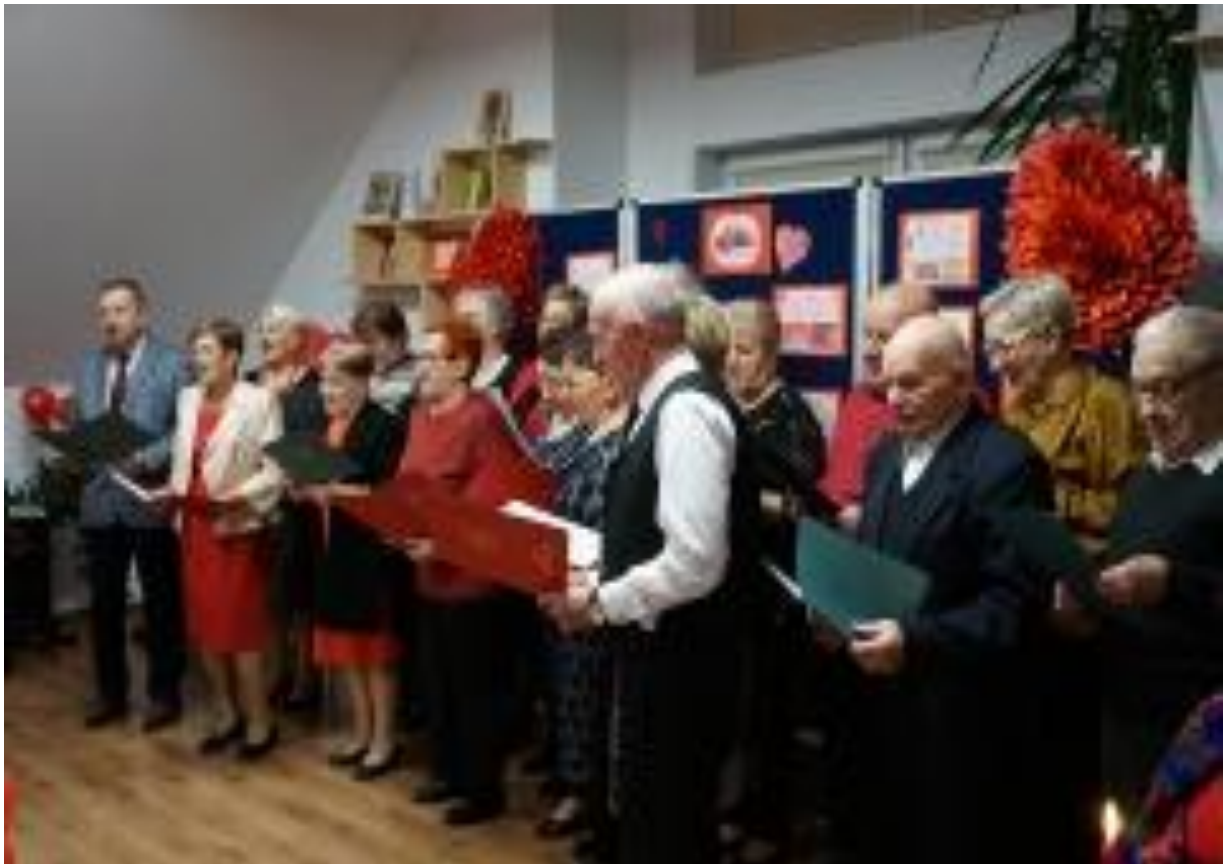
Luty 2024r. Walentynki