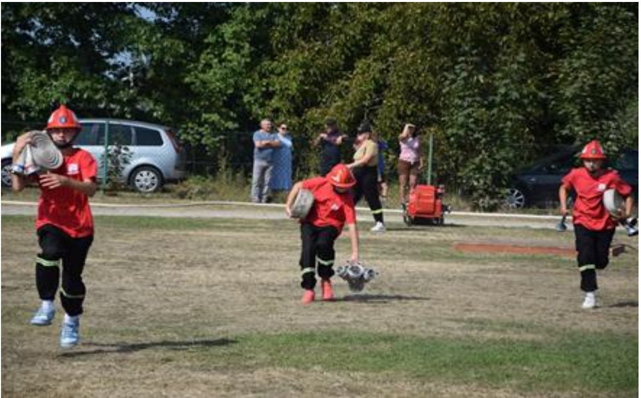
Gminne Zawody Sportowo – Pożarnicze OSP i MDP.– 1.09.2024r.