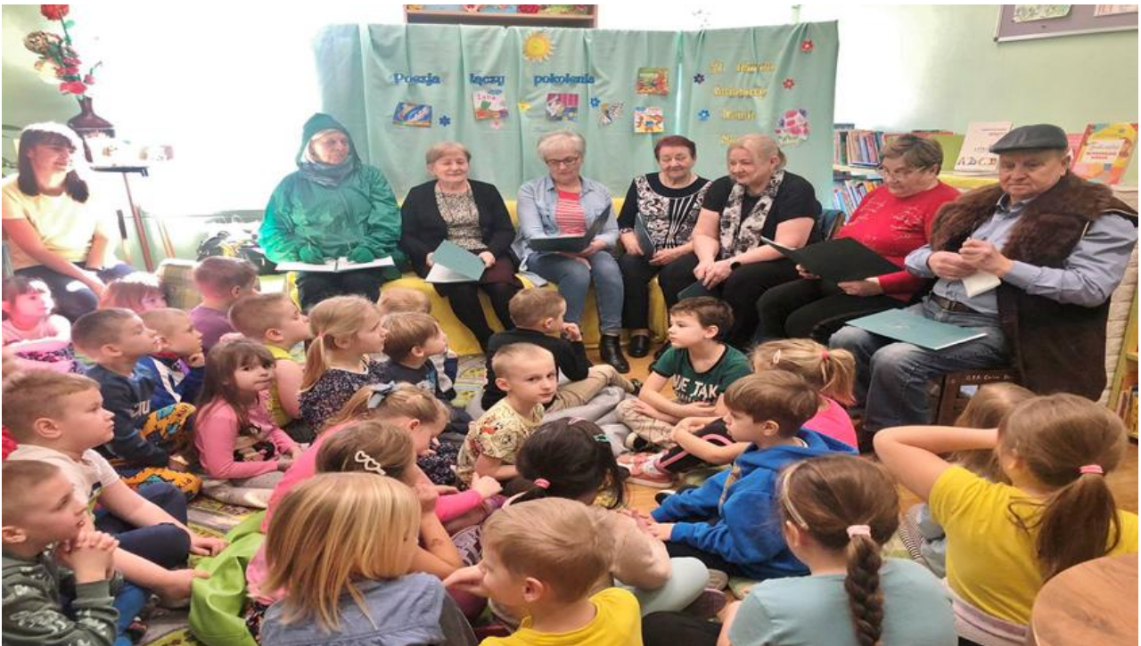
Poezja łączy pokolenia. Spotkanie dzieci przedszkolnych z seniorami z klubu Senior+.