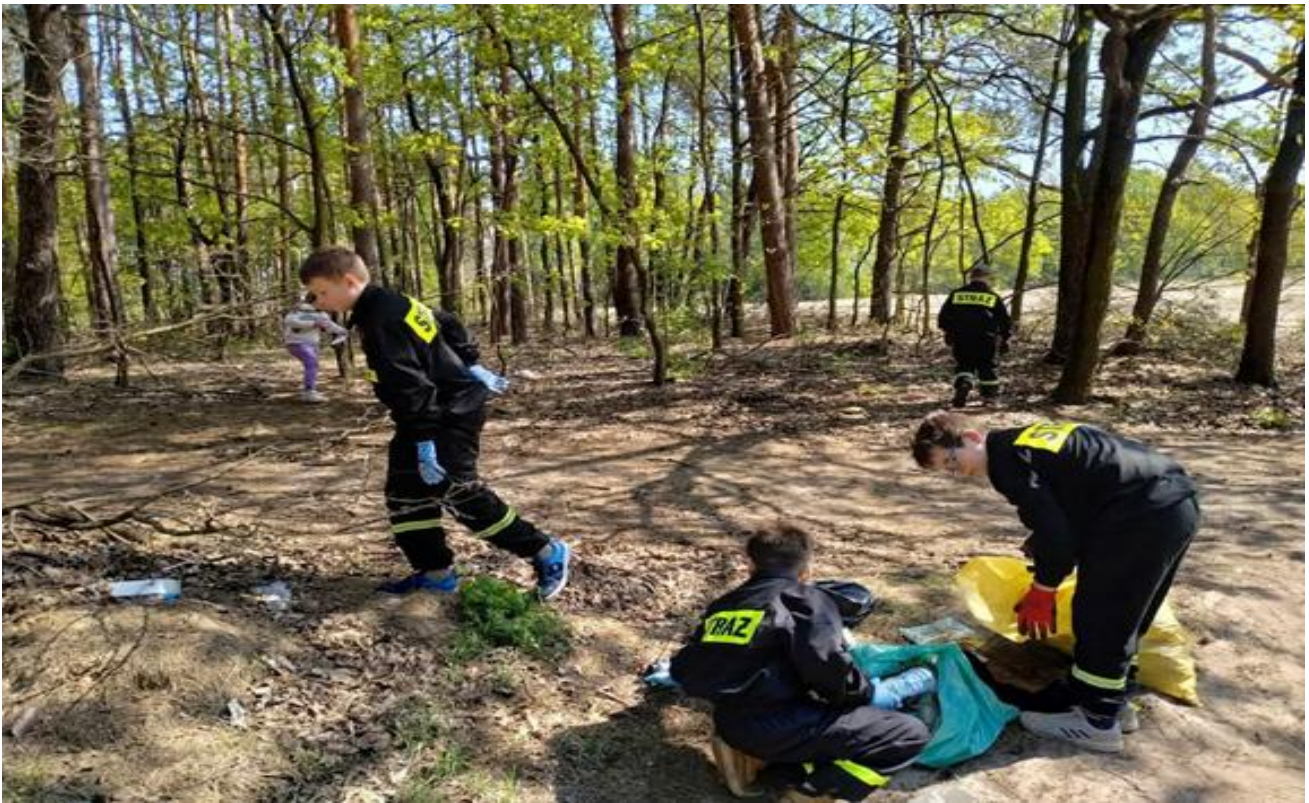
„Wiosenne sprzątanie ze strażakami” – 27.04.2024 r.