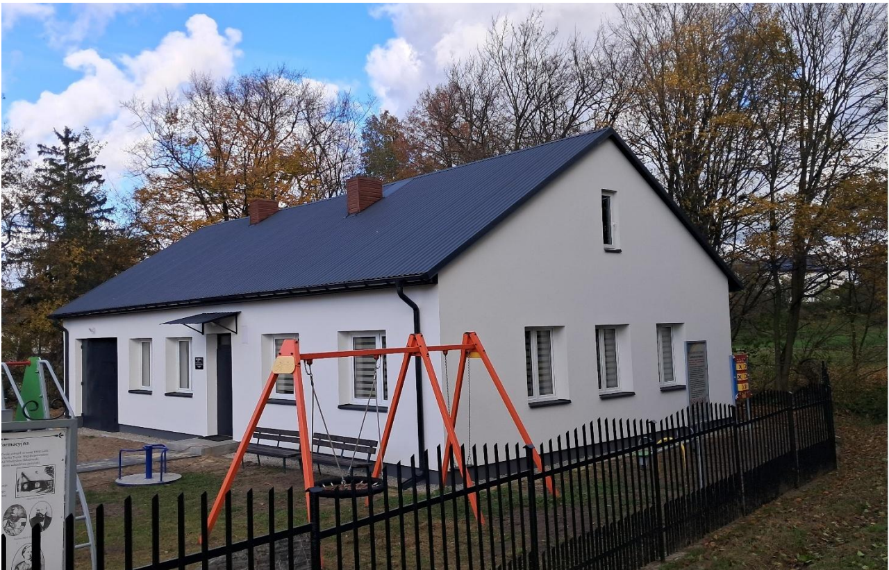
„Remont świetlicy wiejskiej w miejscowości Zwola”