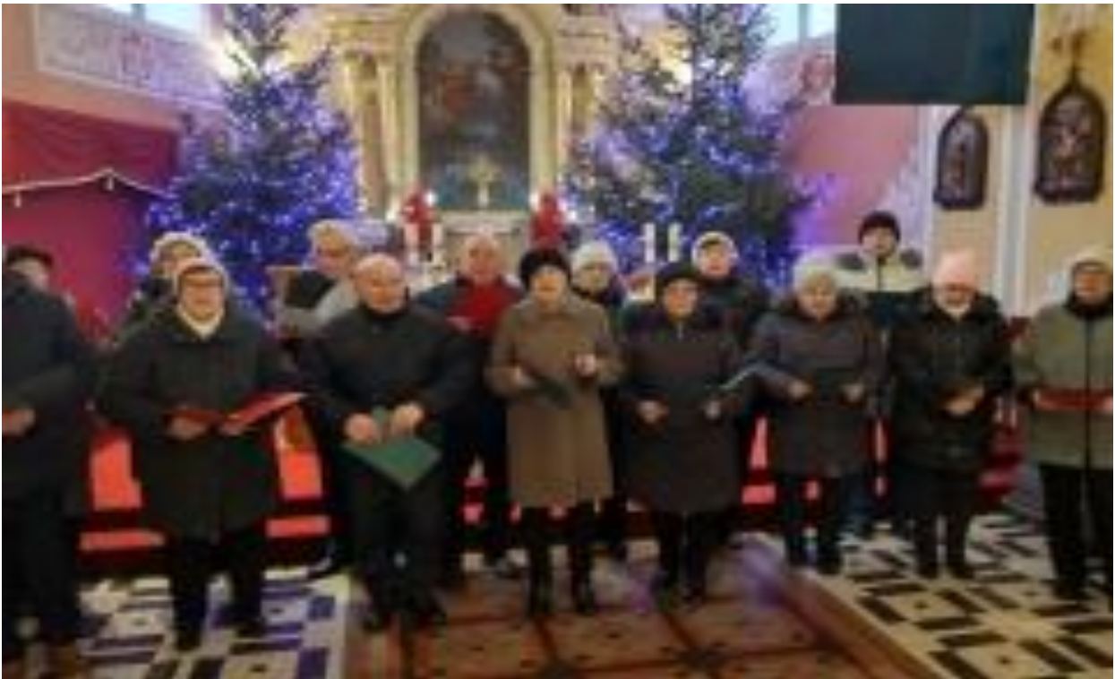
Styczeń 2024r. – Kolędowanie w kościele parafialnym w Oleksowie.