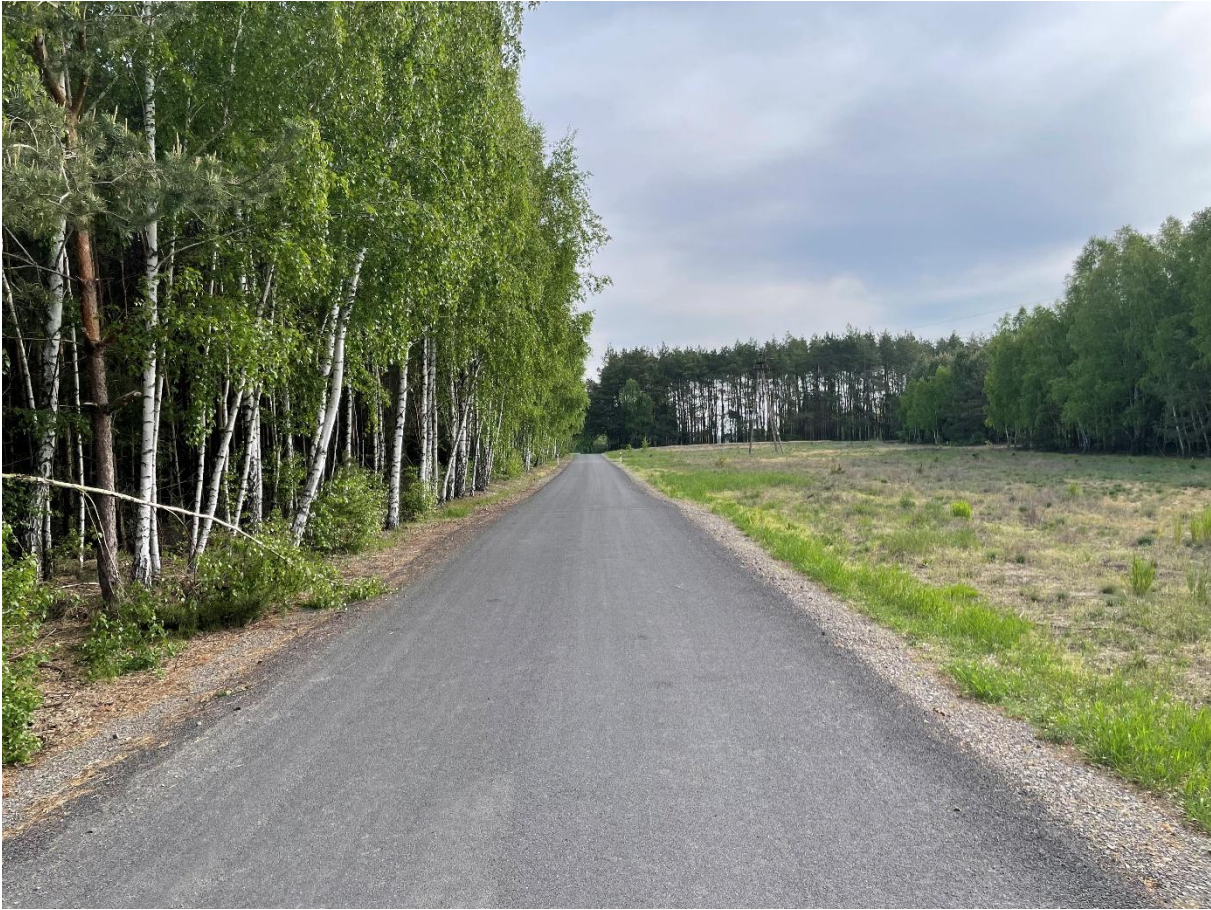
Przebudowa odcinka drogi w miejscowości Sławczyn.

„Przebudowa odcinka drogi w Zwoli” cena brutto: 514 637,41 zł.