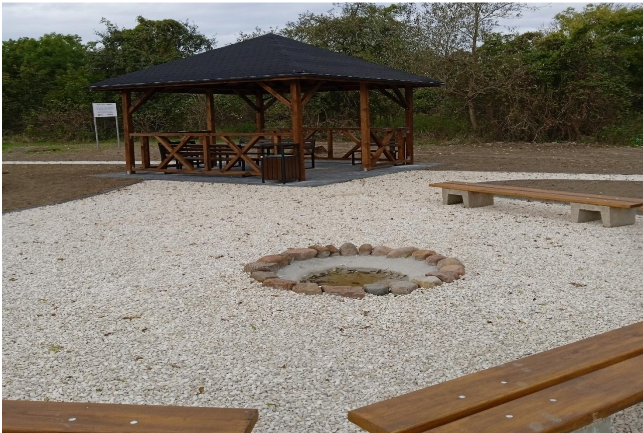
Utworzenie miejsca rekreacji w miejscowości Oleksów

W ramach tej inwestycji wykonano nawierzchnię placu pod altaną z kostki betonowej, altanę drewnianą, utwardzono nawierzchnię ścieżek, zamontowano stół, ławki, kosz na śmieci, stojak na rowery oraz utworzono miejsce na ognisko.