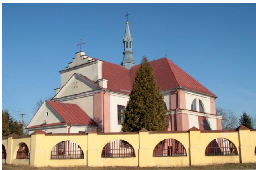
Kościół pw. św. Stanisława bp. m. w Oleksowie.

10) Uchwałą nr IV/27/24 Rady Gminy w Gniewoszowie z dnia 12 września 2024 r. przyznano dotację celową na prace konserwatorskie, restauratorskie lub roboty budowlane przy zabytkach wpisanych do rejestru zabytków położonych na terenie Gminy Gniewoszów na prace konserwatorskie, restauratorskie lub roboty budowlane przy zabytkach wpisanych do rejestru zabytków lub znajdujących się w Gminnej Ewidencji Zabytków na rzecz Parafii Rzymskokatolickiej pw. Świętego Stanisława Biskupa i Męczennika w Oleksowie, na zadanie pn. ” Remont konserwatorski zabytkowej dzwonnicy oraz ogrodzenia wokół Kościoła pw. Stanisława bp. i m.” w kwocie – 500.000,00 zł. Gmina Gniewoszów otrzymała wstępną promesę z Rządowego Programu Odbudowy Zabytków Polski Ład na zadanie w kwocie 490.000,00 zł. W tym gmina przekaże w formie wkładu własnego do inwestycji dotację w kwocie 10.000,00 zł. Prace dotyczą robót remontowo-konserwatorskich zabytkowej dzwonnicy oraz ogrodzenia wokół kościoła.