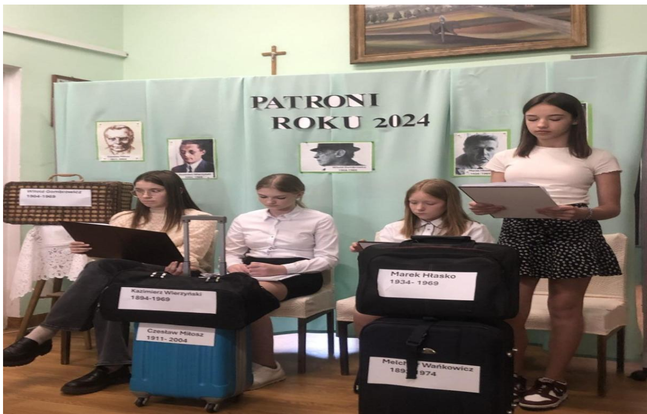
Młodzież szkolna podczas Tygodnia Bibliotek 2024.