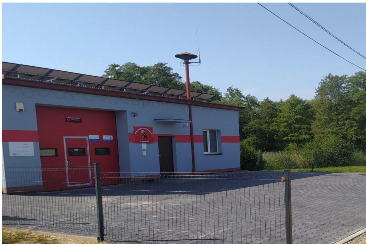
Utwardzenie placu przy Remizie OSP w Sarnowie

Inwestycja stanowi ostatni etap budowy kanalizacji sanitarnej w m. Regów Stary, umożliwia przyłączenie, co najmniej, 50 budynków mieszkalnych i zwiększenie poziomu wykorzystania wydajności oczyszczalni ścieków w Oleksowie.