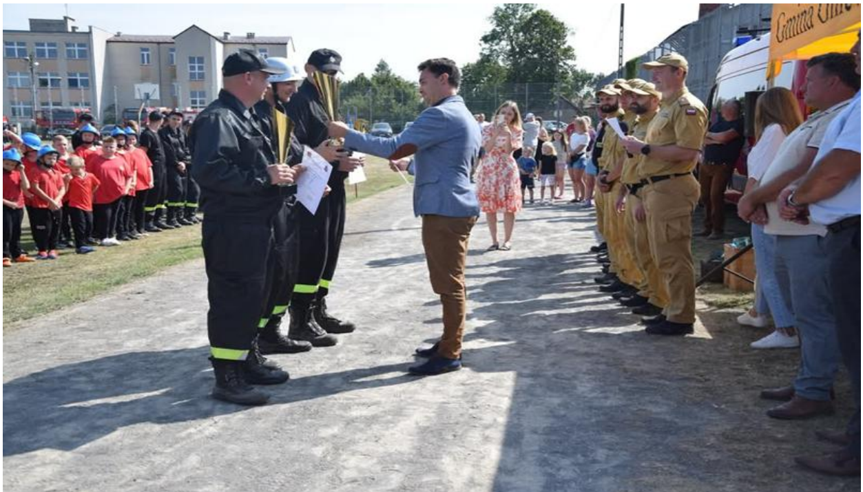
Gminne Zawody Sportowo – Pożarnicze OSP i MDP.– 1.09.2024r.