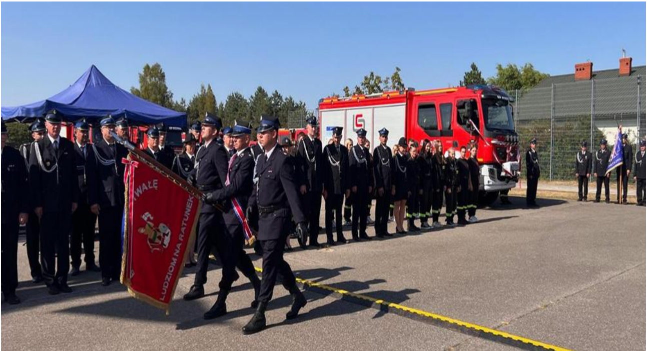
Uroczystość przekazania jednostce OSP Wysokie Koło nowego pojazdu pożarniczego – 8.09.2024r.r.