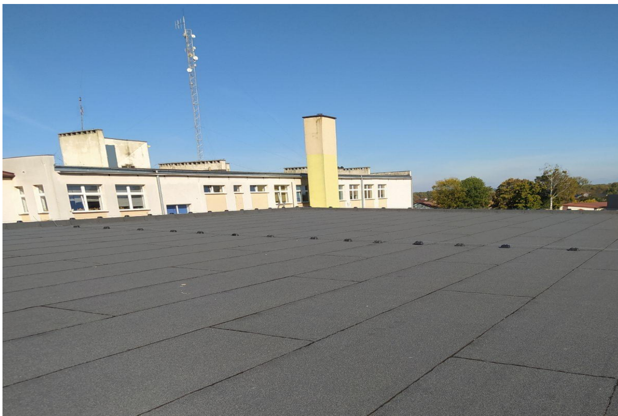
Modernizacja sali gimnastycznej i zaplecza w szkole podstawowej w Gniewoszowie

Uchwałą Nr XXII/145/16 Rady Gminy Gniewoszów z dnia 28 grudnia 2016 r. zatwierdzono Lokalny Program Wspierania Edukacji Uzdolnionych Dzieci i Młodzieży ze szkół z terenu Gminy Gniewoszów. W Regulaminie przyznawania stypendium Wójta Gminy Gniewoszów określone zostały również zasady, formy oraz szczegółowe warunki przyznawania Stypendium Wójta Gminy Gniewoszów dla uczniów uczęszczających do placówek oświatowych prowadzonych przez gminę Gniewoszów. W roku szkolnym 2023/2024 warunki określone w ww. regulaminie spełniło 21 uczniów uczęszczających do naszych placówek oświatowych i każdy uczeń otrzymał jednorazowe stypendium w wysokości 476, 19 zł.