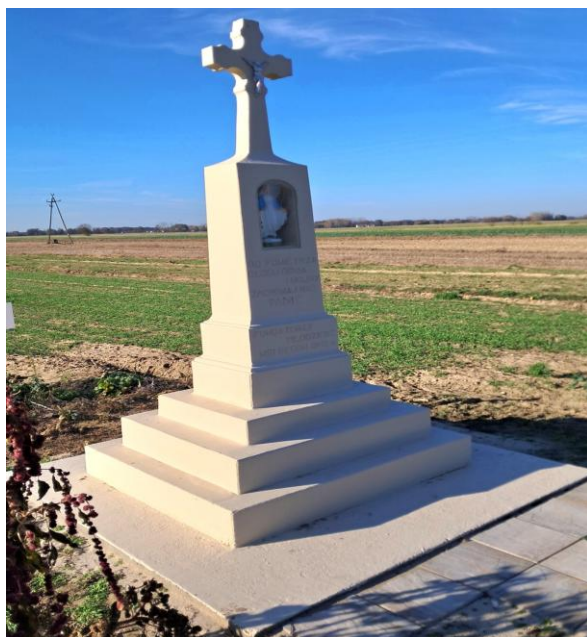
Kapliczka przydrożna z 1942 r. w Regowie Starym

8) W 2024 r. pozyskano dotację z budżetu Województwa Mazowieckiego w ramach Mazowieckiego Instrumentu Wsparcia Zachowania i Tworzenia Miejsc Pamięci Narodowej pn. „Mazowsze dla miejsc pamięci 2024” na dofinansowanie w 80 % prac remontowych i konserwatorskich kapliczki przydrożnej w Regowie Starym (działka ewidencyjna nr 410). Zakres rzeczowy zadania polegał na wymurowaniu podstawy kapliczki (trzech schodków), wykonaniu tynku wyrównującego na całej kapliczce, malowaniu całej kapliczki farbą specjalistyczną, odnowieniu znajdujących się na kapliczce inskrypcji oraz figurki Matki Boskiej.