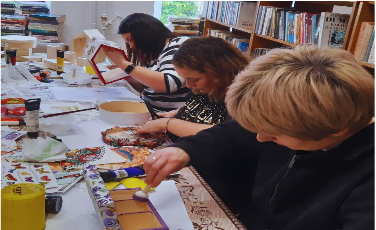
Warsztaty decoupage dla młodych mam.