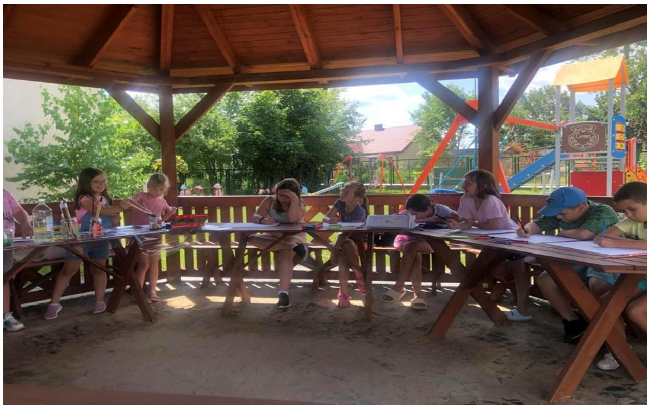
Wakacje w bibliotece 2024.