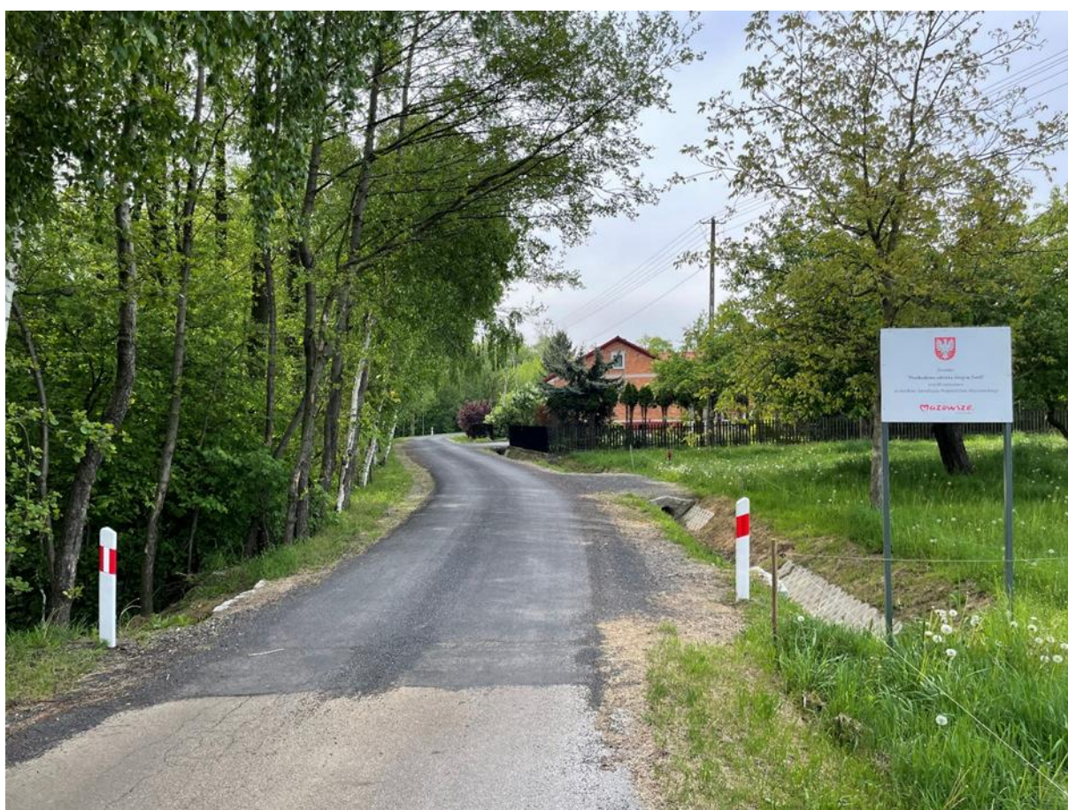
Przebudowa odcinka drogi w miejscowości Zwola