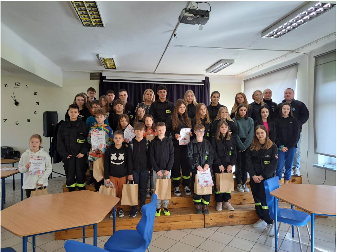
Ogólnopolski Turniej Wiedzy Pożarniczej pn. „Młodzież zapobiega pożarom” - 01.03.2023r.