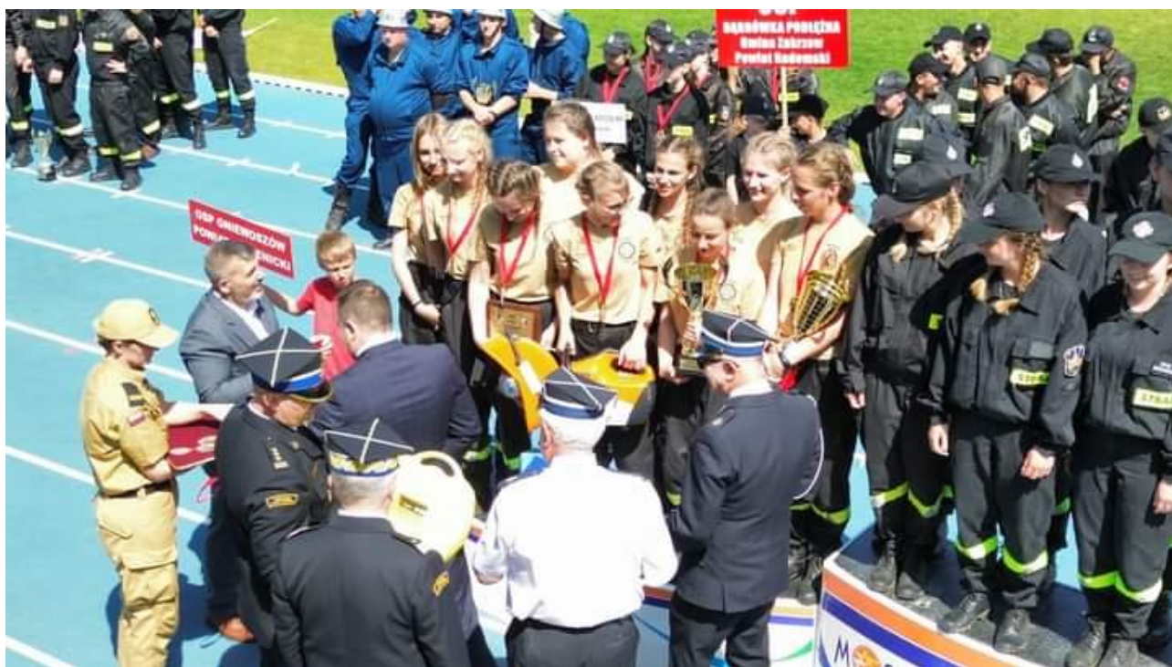
VII Wojewódzkie Zawody Sportowo – Pożarnicze Ochotniczych Straży Pożarnych w Mławie -10.06.2023r.