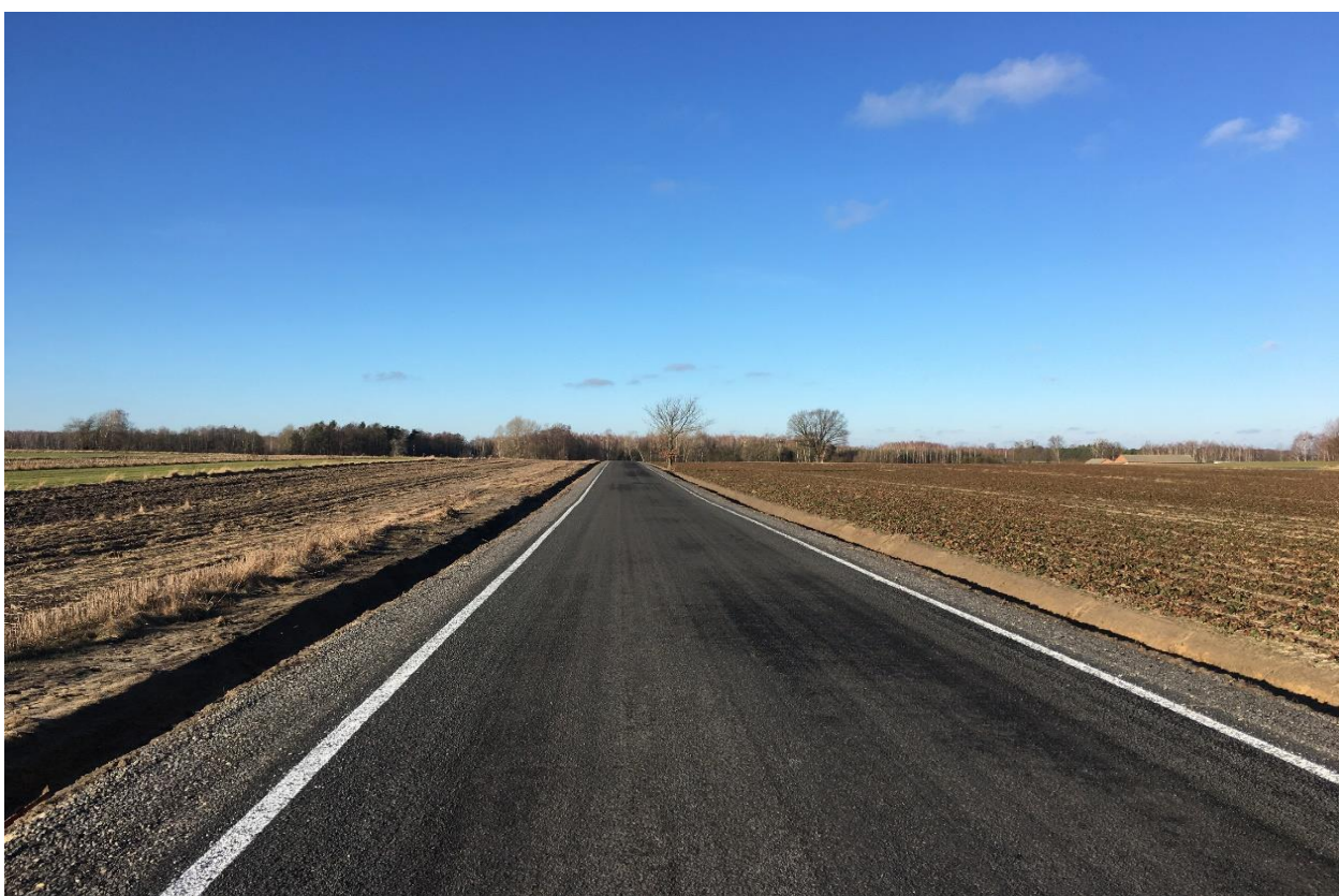
Przebudowa odcinka drogi w miejscowości Markowola.

Przebudowa odcinka drogi w miejscowości Gniewoszów (ul. Dolna), cena brutto: 319 240,35 zł.