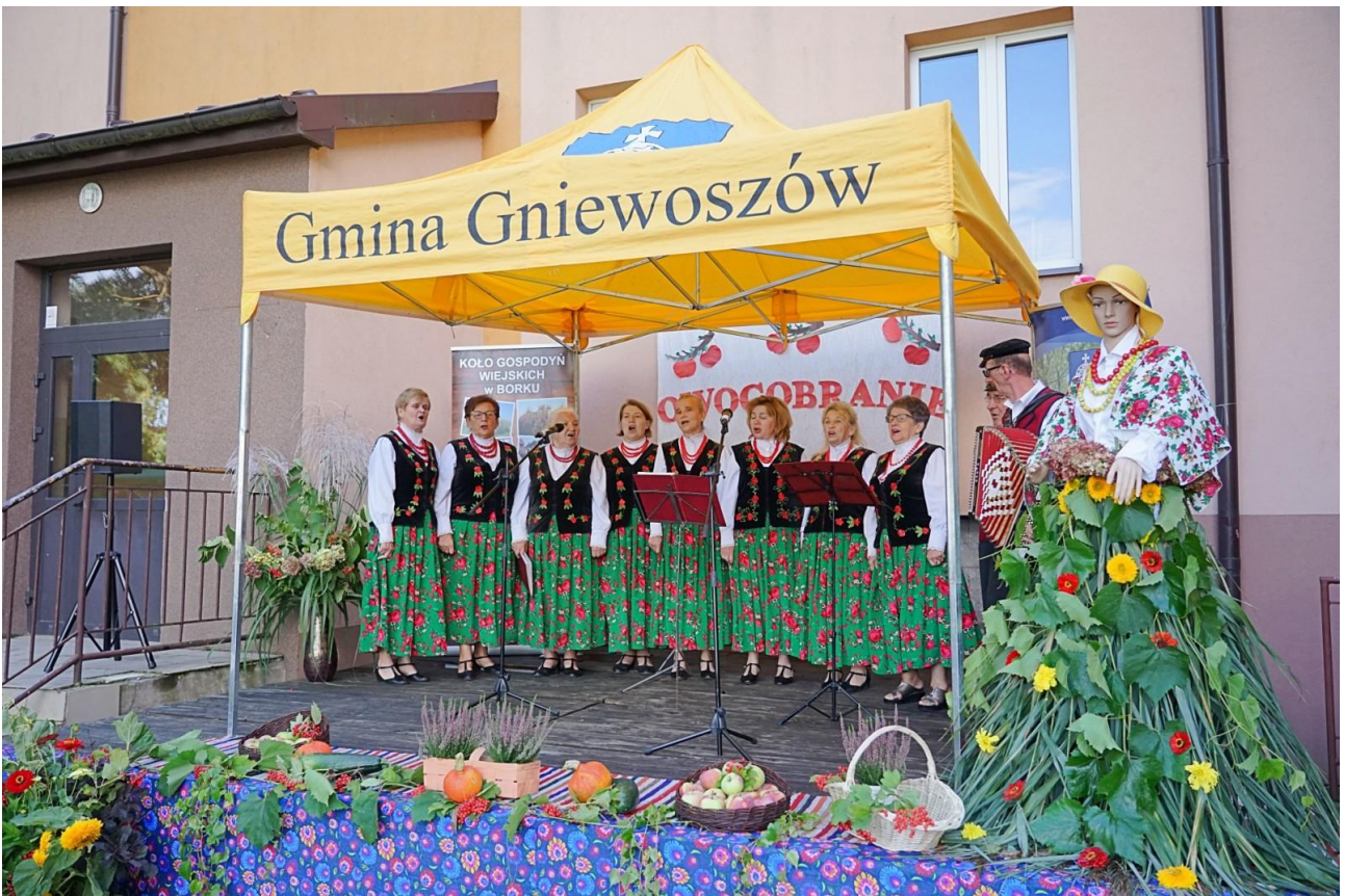
„Owocobranie” w Borku – 03.09.2023r.