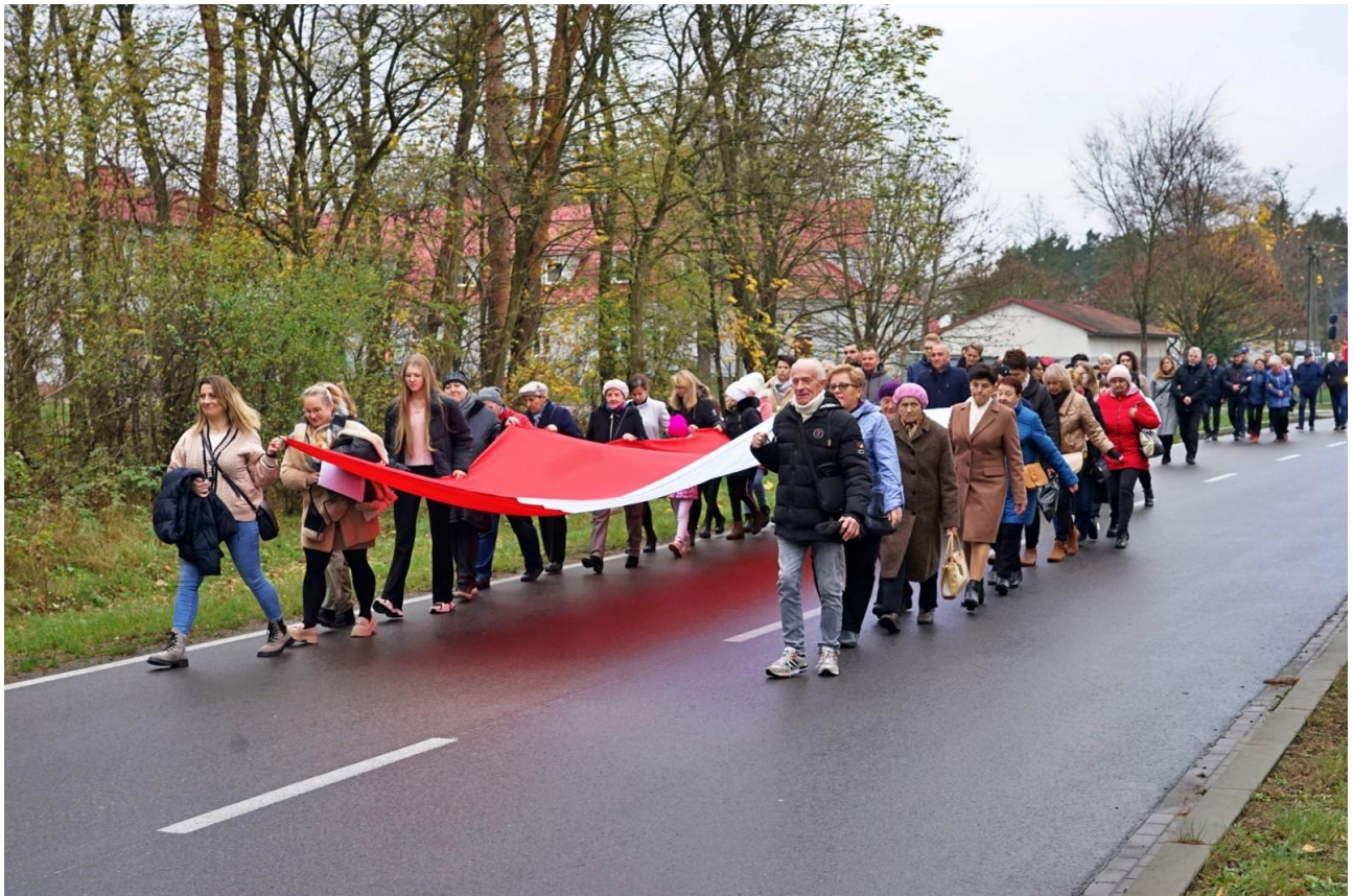
105 rocznica odzyskania przez Polskę niepodległości – 11.11.2023r.