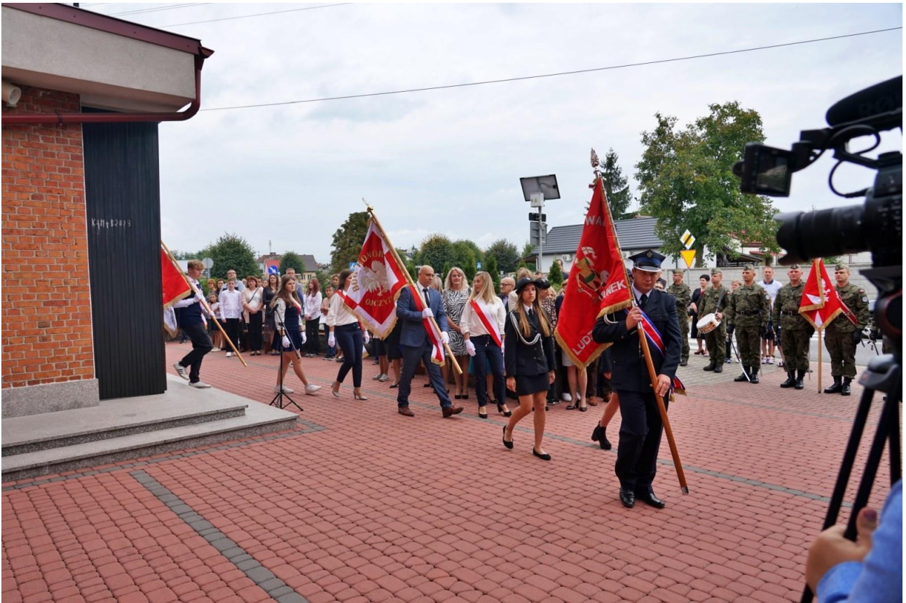
Uroczystości ku czci Lotników Ziemi Gniewoszewskiej – 24.09.2023r.