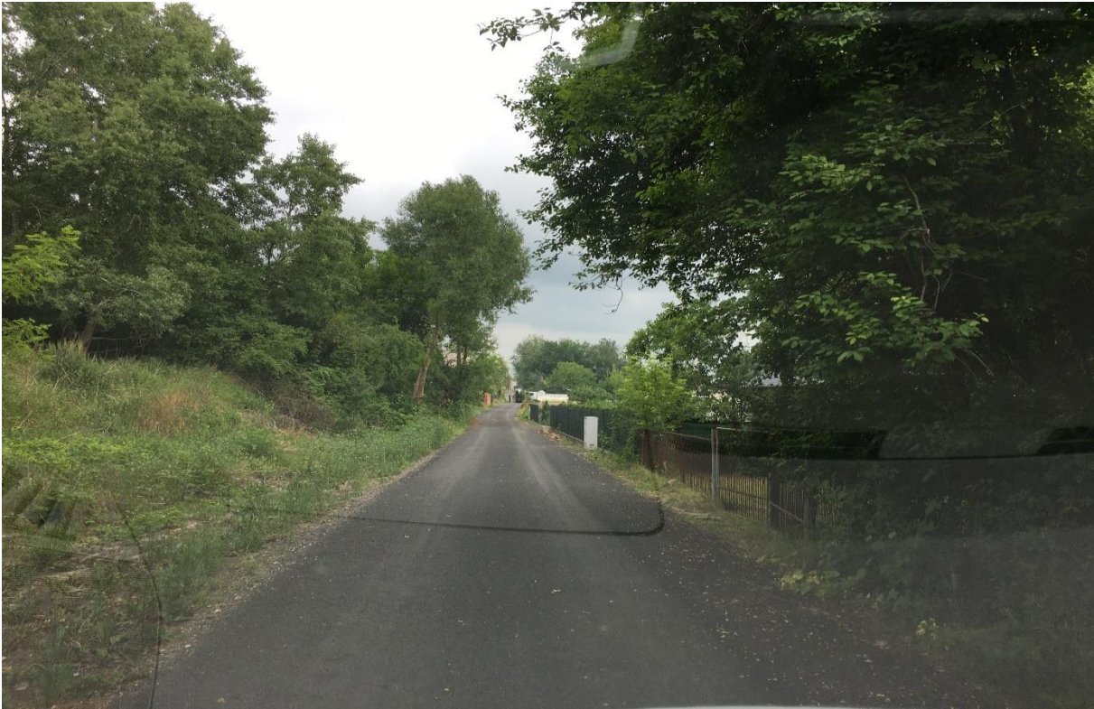
Przebudowa odcinka drogi w miejscowości Gniewoszów (ul. Dolna)

Przebudowa odcinka drogi w miejscowości Sarnów” (wzdłuż torów kolejowych w kierunku wschodnim od drogi wojewódzkiej nr 788), cena brutto: 274 940,67 zł.