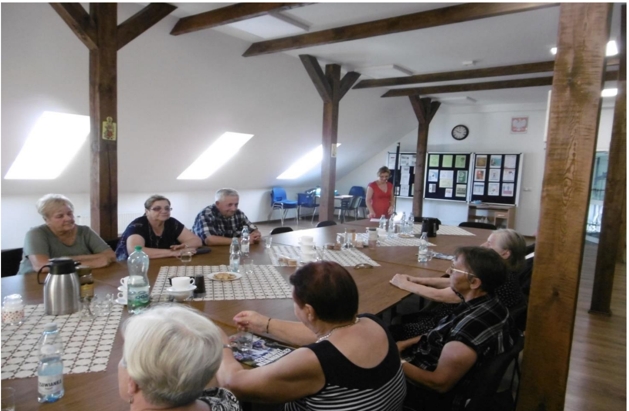
Cykl spotkań z dietetykiem w Klubie „SENIOR+” – sierpień 2023 r.