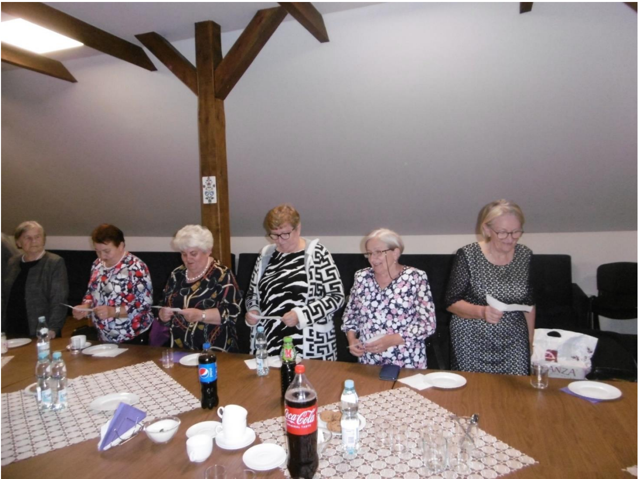
Dzień Chłopaka w Klubie „SENIOR+” – 01.10.2023 r.