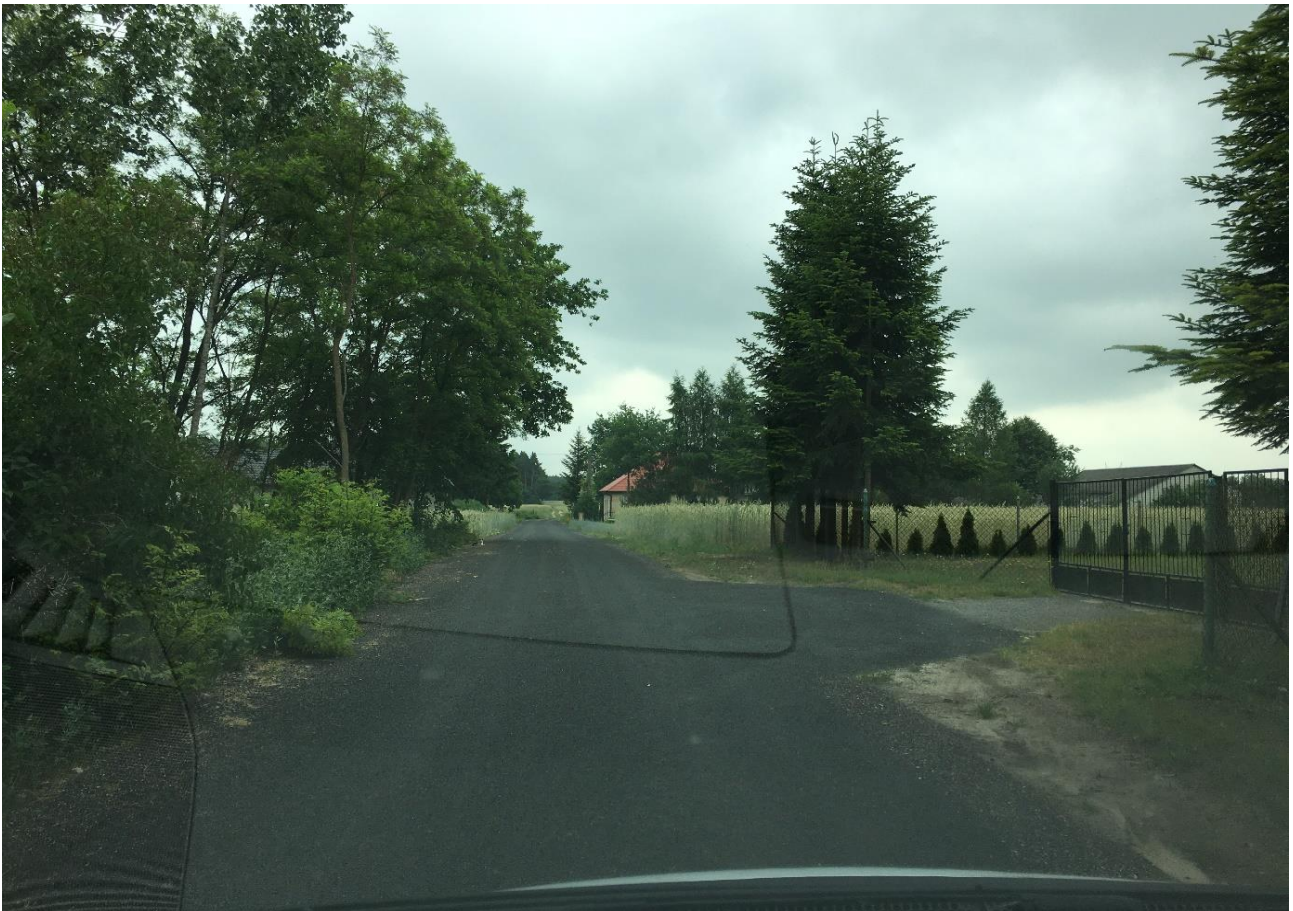
Przebudowa odcinka drogi w miejscowości Sarnów-I,(od drogi wojewódzkiej 788 do posesji nr 127)