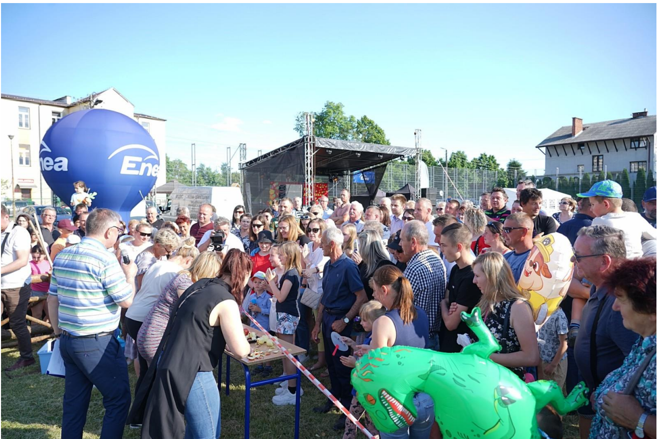
Festyn Rodzinny z okazji Międzynarodowego Dnia Dziecka oraz V Spartakiada Sołectw z ENEC – 04.06.2023r.