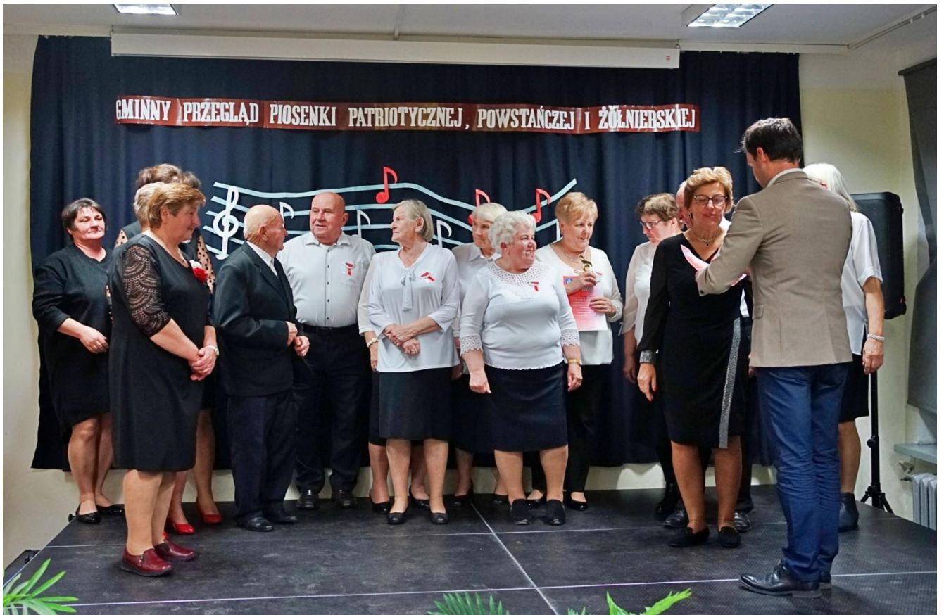
VII Gminny Przegląd Piosenki Patriotycznej, Powstańczej i Żołnierskiej Gniewoszów 2023 – 10.11.2023r.