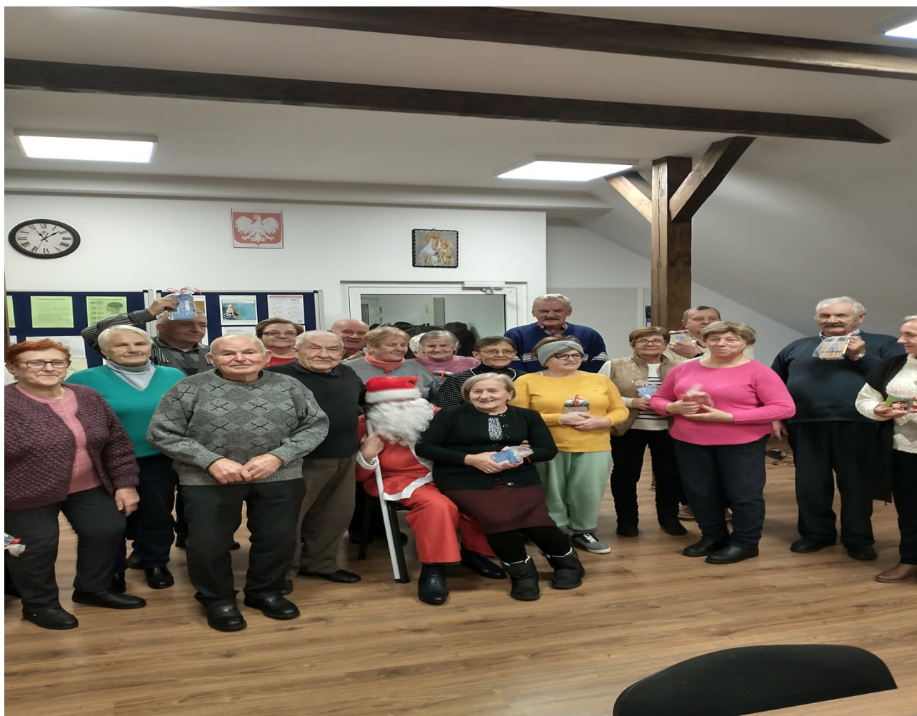
Mikołajki w Klubie „SENIOR+” -6.12.2023 r.

Klubowicze rozwijają również własne zainteresowania i zdolności artystyczne: szydełkowanie, haftowanie, robienie na drutach i inne według własnych upodobań.