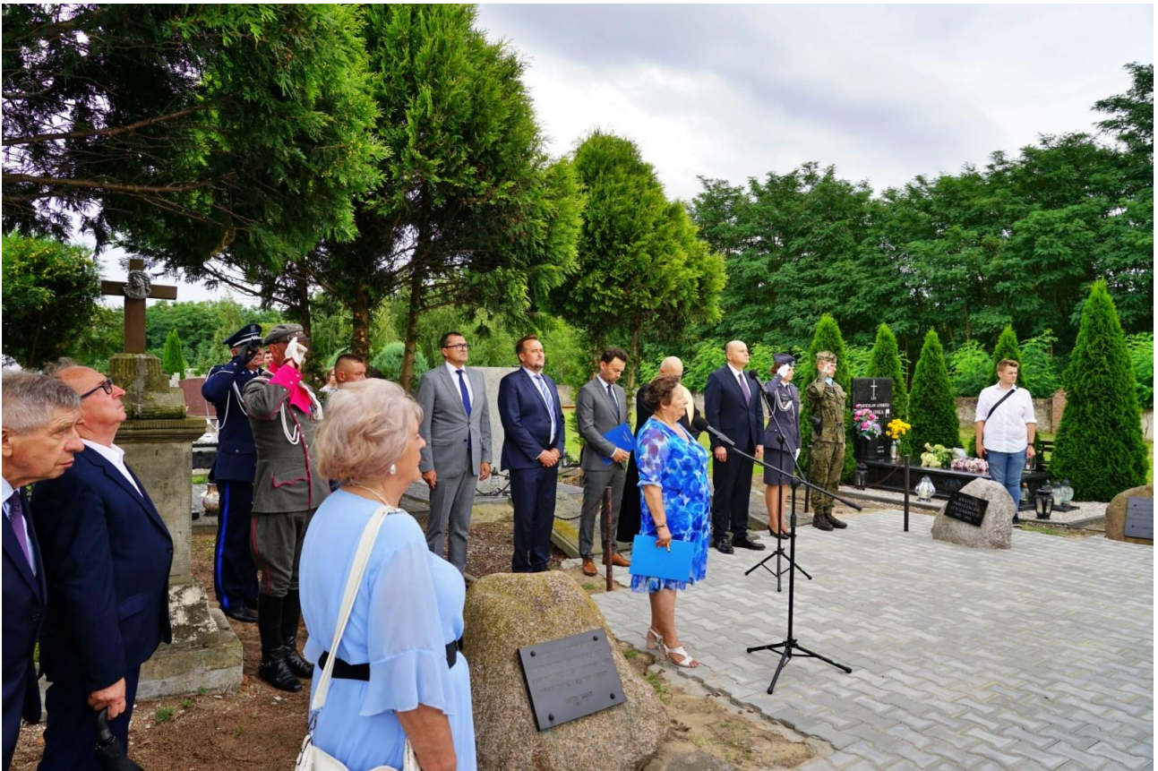
Uroczystości w Oleksowie upamiętniające bohaterów walczących o wolność ojczyzny w czasie powstania listopadowego, styczniowego oraz I i II wojny światowej – 06.08.2023r.