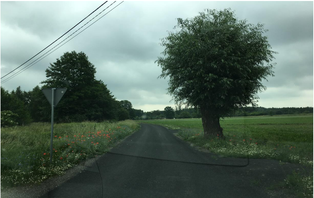
„Przebudowa odcinka drogi w miejscowości Sarnów” (wzdłuż torów kolejowych w kierunku wschodnim od drogi wojewódzkiej nr 788)

Przebudowa odcinka drogi w miejscowości Sarnów-I,(od drogi wojewódzkiej 788 do posesji nr 127) cena brutto: 83 809,25 zł.