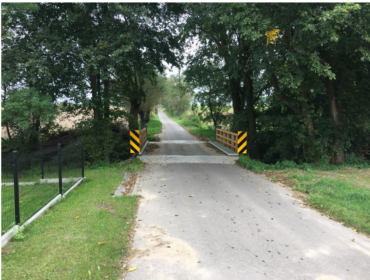
Most w Boguszówce po remoncie