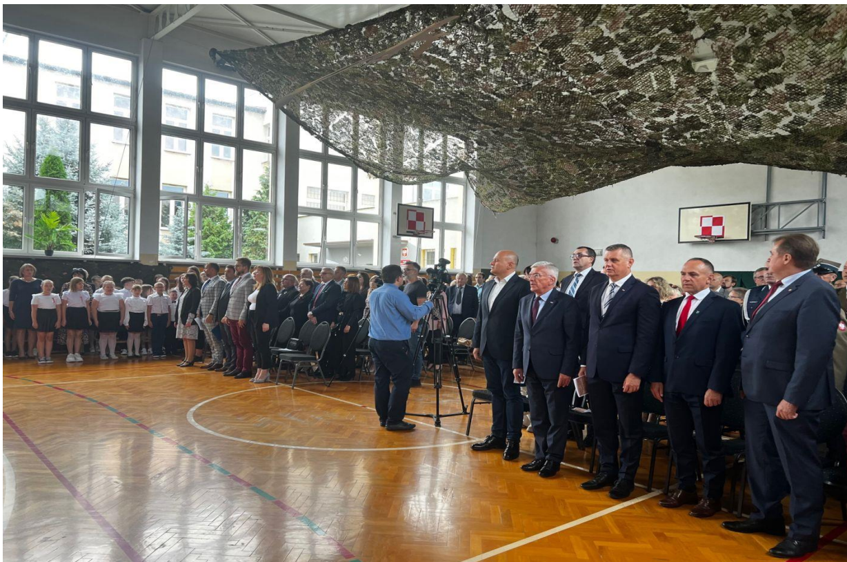
Uroczystość nadania Publicznej Szkole Podstawowej w Gniewoszowie im. Lotników Ziemi Gniewoszowskiej – 24.09.2023 r.