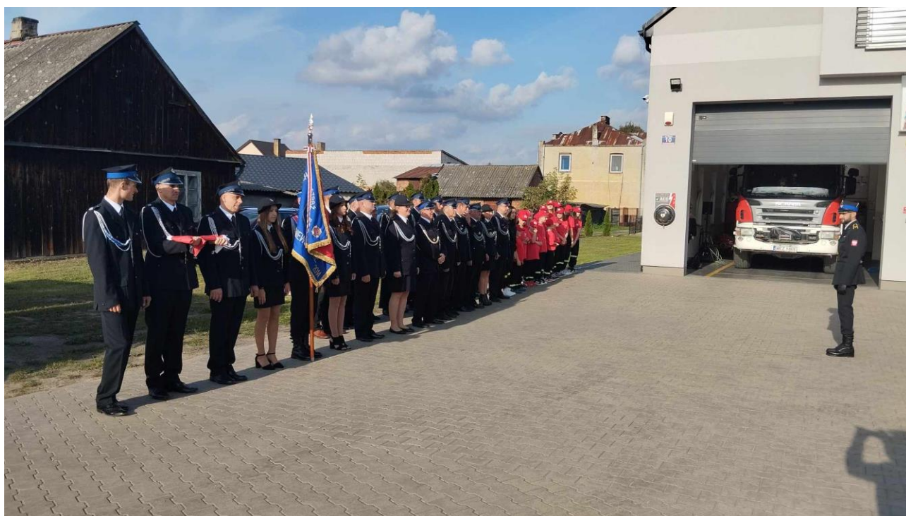
Uroczystość przekazania jednostkom OSP pojazdów pożarniczych – 13.10.2023r.