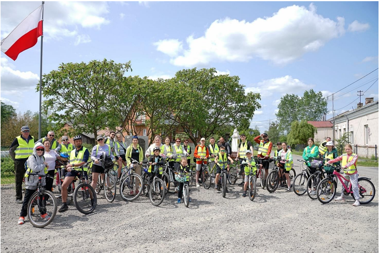
Rajd rowerowy pn. „Śladami rodzin Skłodowskich i Boguskich” – 27.05.2023r.