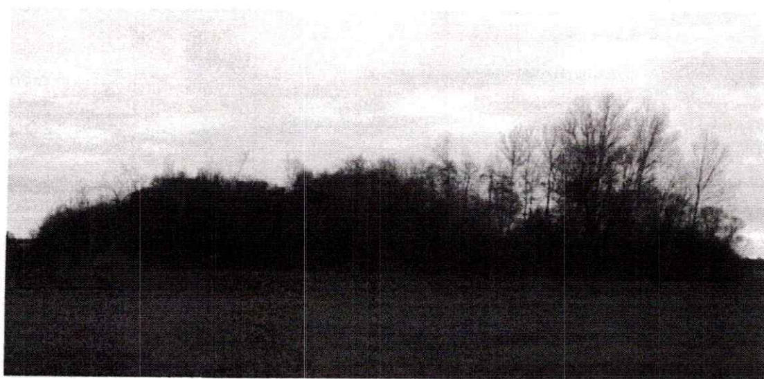
Widok na grodzisko stożkowate w Oleksowie

Jednym z najwartościowszych stanowisk archeologicznych na terenie gminy pod względem naukowo-badawczym, a także archeoturystycznym, wydaje się być gródek stożkowaty Oleksów stan.1 , a także grodzisko pierścieniowate Oleksów- Sławczyn stan.2 . Obiekty te zachowane są w postaci ziemnych nasypów i zostały przebadane w latach 70 i 80 przez Pracownię Konserwacji Zabytków (PP PKZ) oddział w Łodzi .Grodzisko stożkowate (Oleksów stan.1) jak wykazały badania sondażowo – weryfikacyjne było użytkowane dwufazowo. Starszą fazę funkcjonowania obiektu datuje się na XIV w. , kiedy powstała tu pierwsza siedziba obronna, którą zniszczył pożar. Natomiast kolejny etap zasiedlenia gródka przypada na okres XV-XVI w. i wiąże się dworem obronnym rodu Gniewoszków.