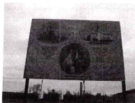
Tablica informacyjna w Regowie Starym